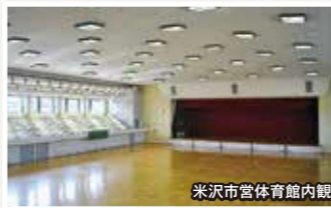
米沢市営体育館内観