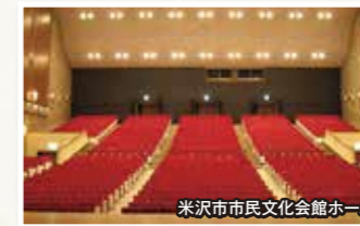
米沢市市民文化会館ホール