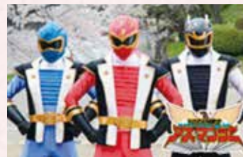
YOZAN 戦士アズマンジャー