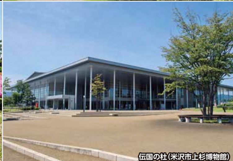
伝国の杜(米沢市上杉博物館)