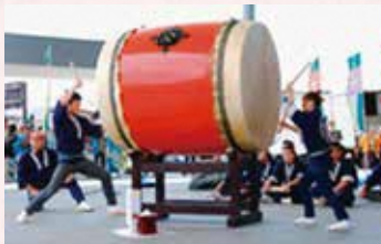
上杉太鼓（民謡一家）