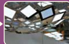
山形大学有機エレクトロニクスイノベーションセンター