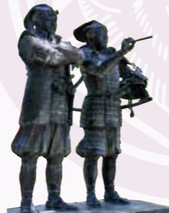
上杉景勝公・直江兼続公主従像 上杉神社内