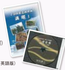
米沢PR用DVD (日本語・英語版)