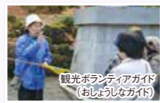
観光ボランティアガイド (おしほうしなガイド)