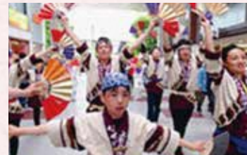
米沢すずめ衆「昆龍」