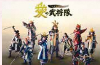
やまがた愛の武将隊