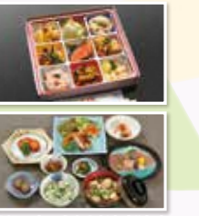
米沢のごっつお弁当 (上)・ご膳 (下)

米沢市に古くから伝わる米沢織と原方刺し子を、より多くの方に親しんでいただきたいという想いから作られた当ビューローオリジナルのノートです。