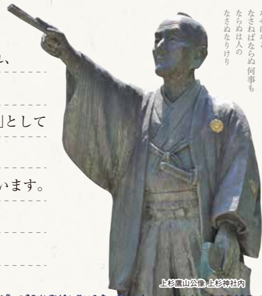
なせばなる なさればならぬ何事も ならぬは人の なさぬなりけり 上杉家山像 上杉神社内

山形県米沢市は、かつて伊達・上杉氏の居城を中心に町並みが形成され、 今なお当時の面影が市内各所に色濃く残っています。 また、近年では東北地方有数の製造品出荷額を誇る「ものづくりのまち」として 発展を遂げています。その中でも代表される「有機EL」は、 山形大学工学部を中心に研究開発が進められ、新産業創出に力を入れています。 歴史と最先端技術が融合する「米沢」に、ぜひお越しください。 「米沢」でのコンベンション開催を心よりお待ちしております。