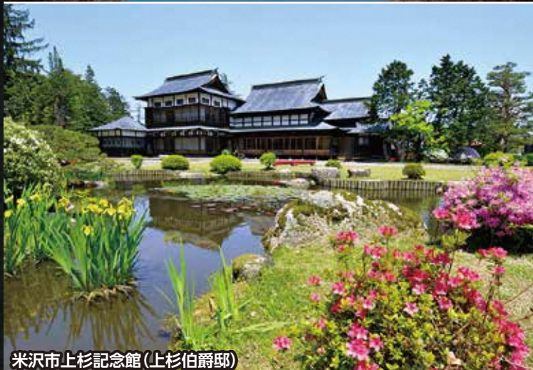
米沢市上杉記念館(上杉伯爵邸)