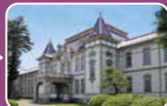
旧米沢高等工業学校本館 (山形大学工学部)