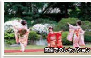
庭園でのレセプション