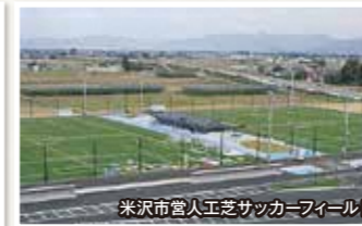
米沢市営人工芝サッカーフィールド

球技やサッカーなどの各種大会・合宿・イベントまで様々なスポーツコンベンションの開催にご利用いただけます。合宿所・トレーニング室・会議室などの付属施設も併設しております。