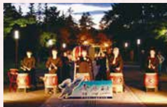
米沢商工会議所青年部「青鷹組」