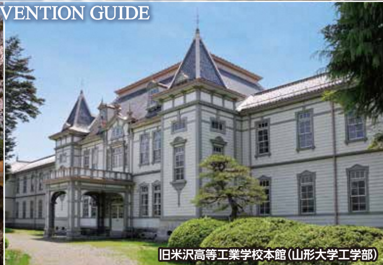
旧米沢高等工業学校本館(山形大学工学部)