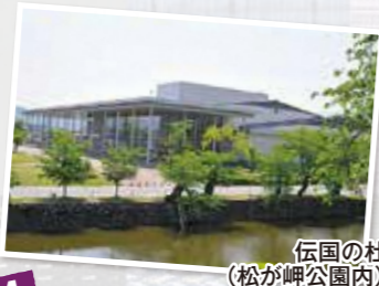
伝国の杜 (松が岬公園内)

コンベンション施設の周辺には、上杉神社をはじめとする人気の観光スポットや飲食店、宿泊施設がまとまっており、移動にも便利です。