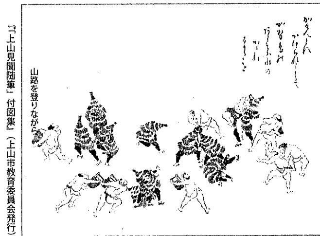
「上山見聞随筆」付図集（上山市教育委員会発行）

勢鳥を披露。御殿では新しい手桶と柄杓で加勢鳥に水をかけ、酒と銭一貫文でねぎらいました。一方の町方加勢は、十五日、周辺部の各村から集まった若衆が、商家の連なる町中の門々を歩き回り、出迎える町の若衆は裸になって手桶の水を争うようにつけ、町人たちは火伏せや商売繁盛を祈願してご祝儀を出し、酒や切り餅を振る舞いました。