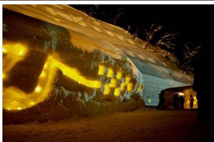
肘折幻想雪回廊(大蔵村)