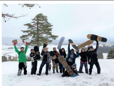
アルカディア雪板乗り体験(長井市)