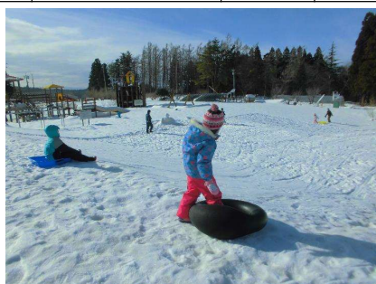
雪であそぼうin風車村(庄内町)