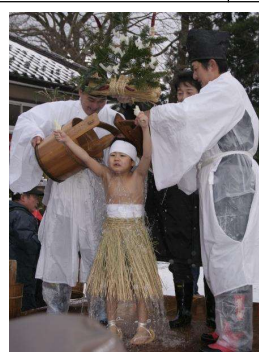
東北の奇祭 やや祭り(庄内町)