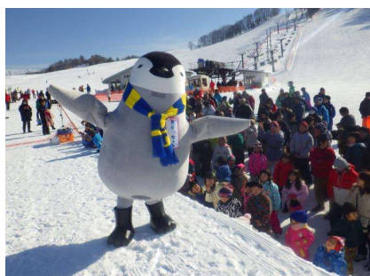
天童高原スキー場(天童市)