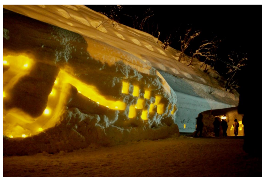
肘折幻想雪回廊(大蔵村)