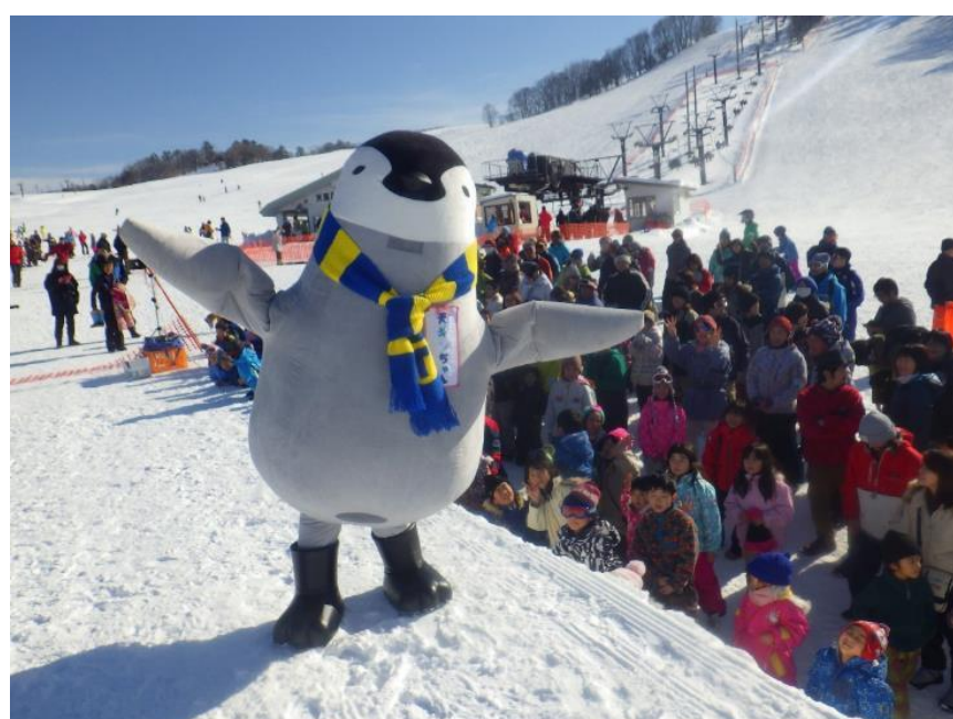
天童高原スキー場(天童市)