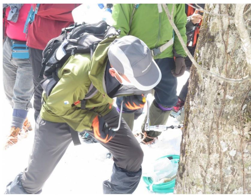
メープル&トレッキング(小国町)