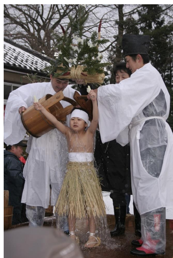
東北の奇祭 ややまつり(庄内町)