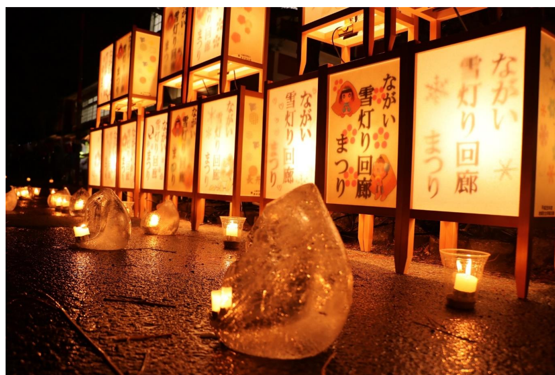
ながい雪灯り回廊まつり(長井市)