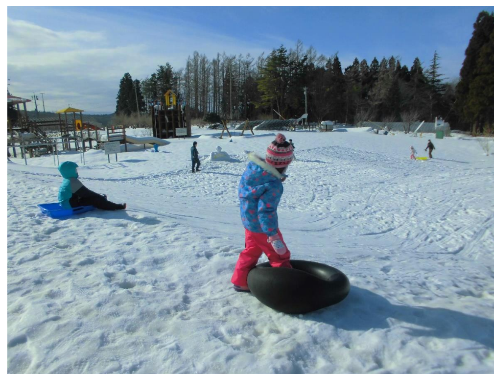
雪であそぼうin風車村(庄内町)