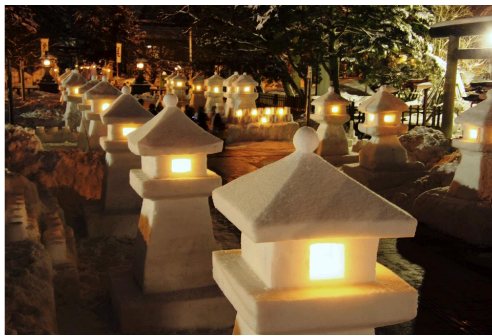
上杉雪灯籠まつり(米沢市)