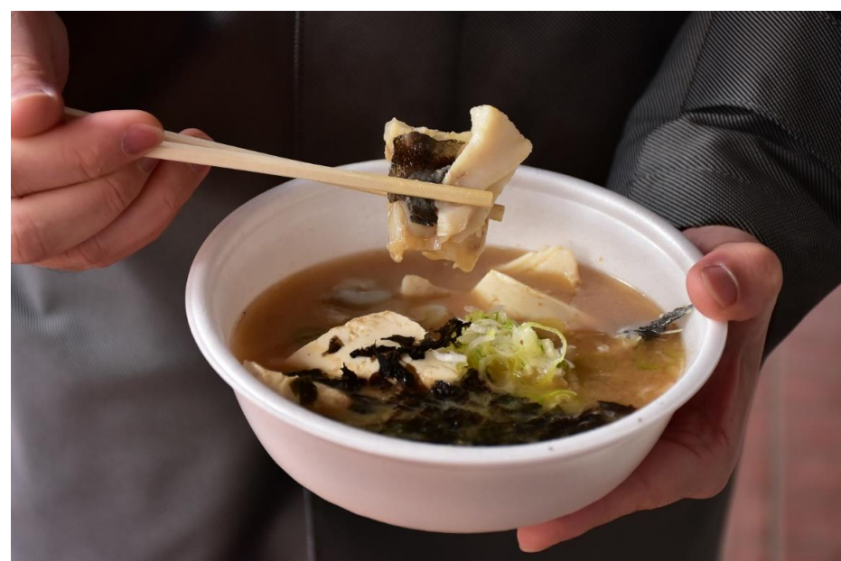
酒田日本海寒鱈まつり(酒田市)