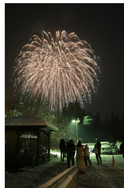
奥おおえ柳川温泉雪まつり(大江町)