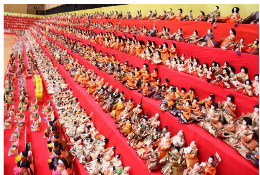
段々ロングなひなまつり(村山市)