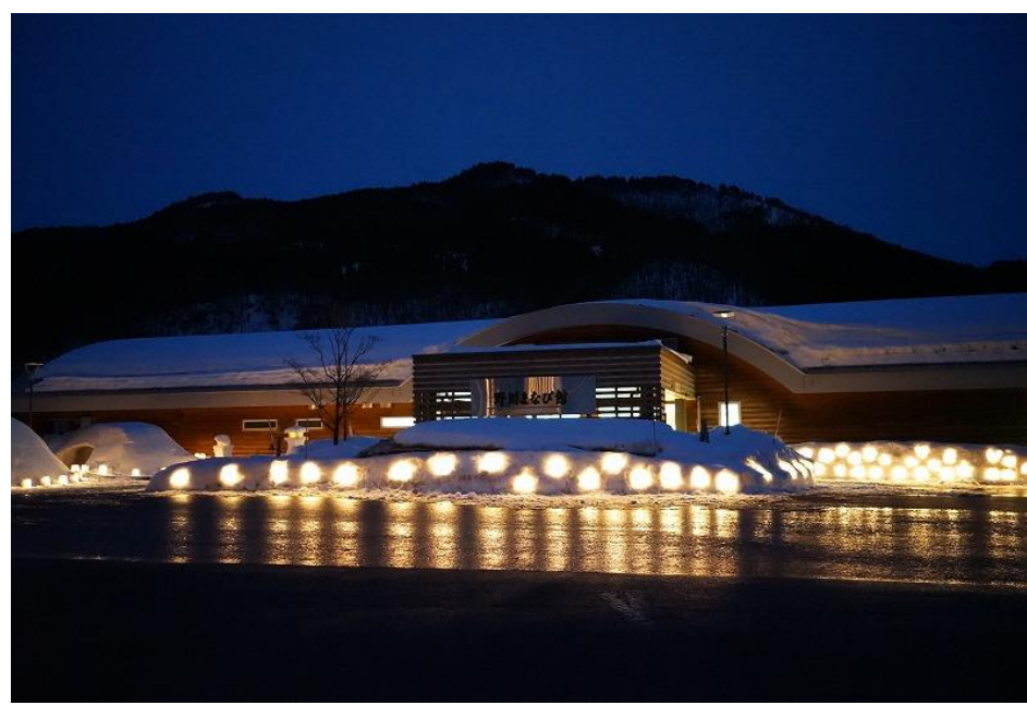
まちとダムをつなぐスノーランタン(長井市)