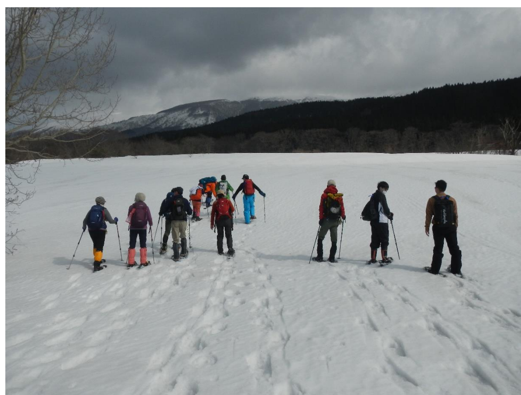
深雪を楽しむ ほでわらミニハイク(遊佐町)