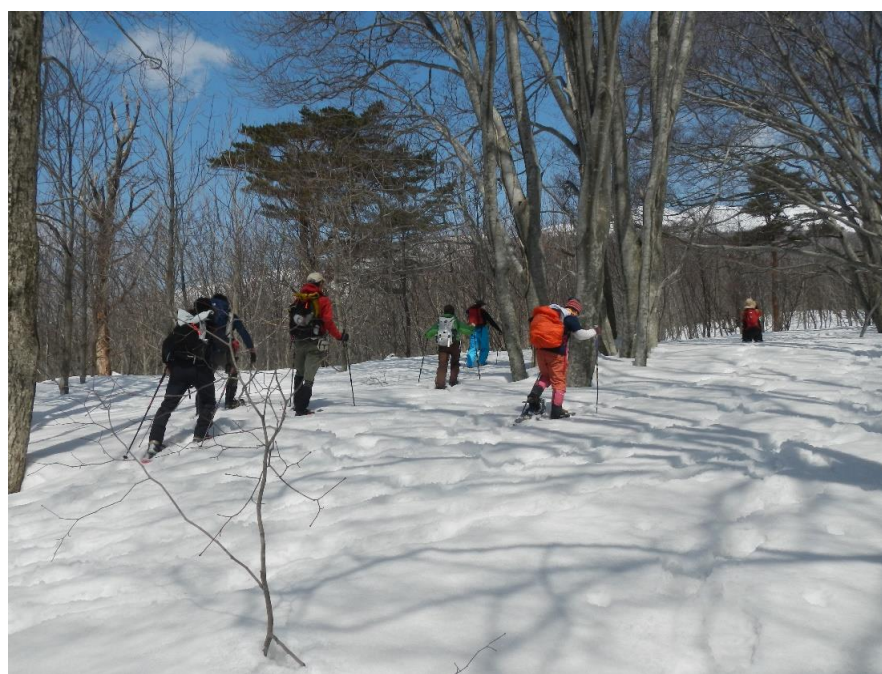
早春の鳥海山 スノーシューハイク(遊佐町)