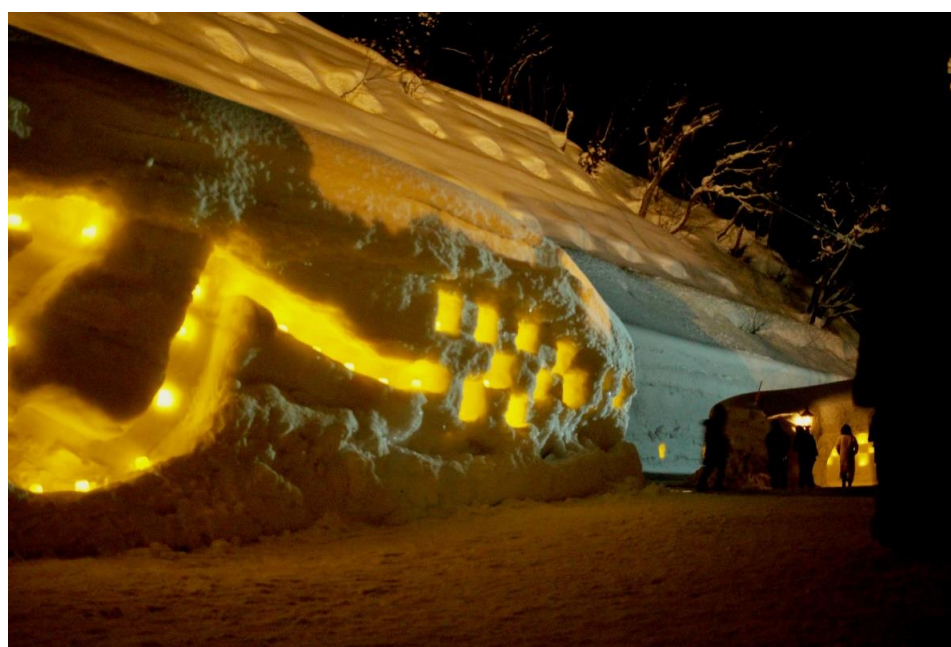
肘折幻想雪回廊(大蔵村)