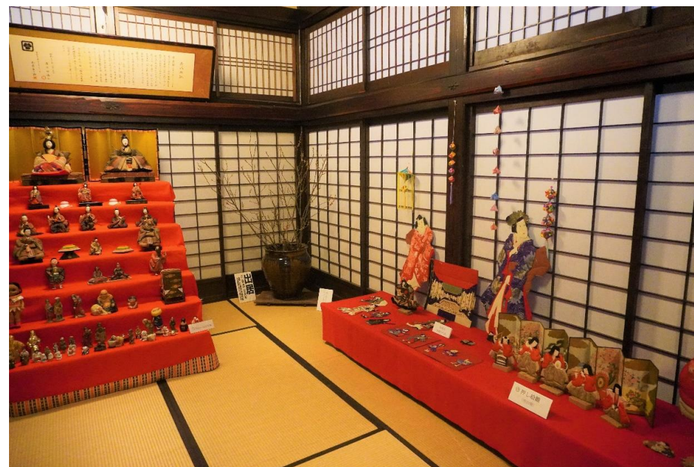
大江のひなまつり(大江町)